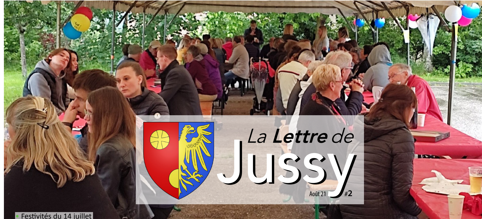
Festivités du 14 juillet

Journal et horaires d'ouverture : Lundi : de 9h à 12h Mardi : de 16h à 19h Jeudi : de 9h à 12h