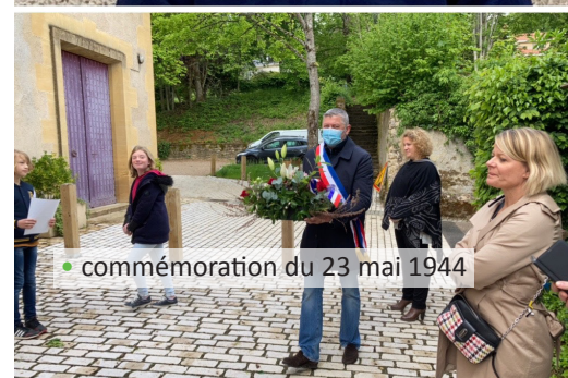
commémoration du 23 mai 1944