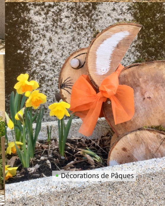
Décorations de Pâques